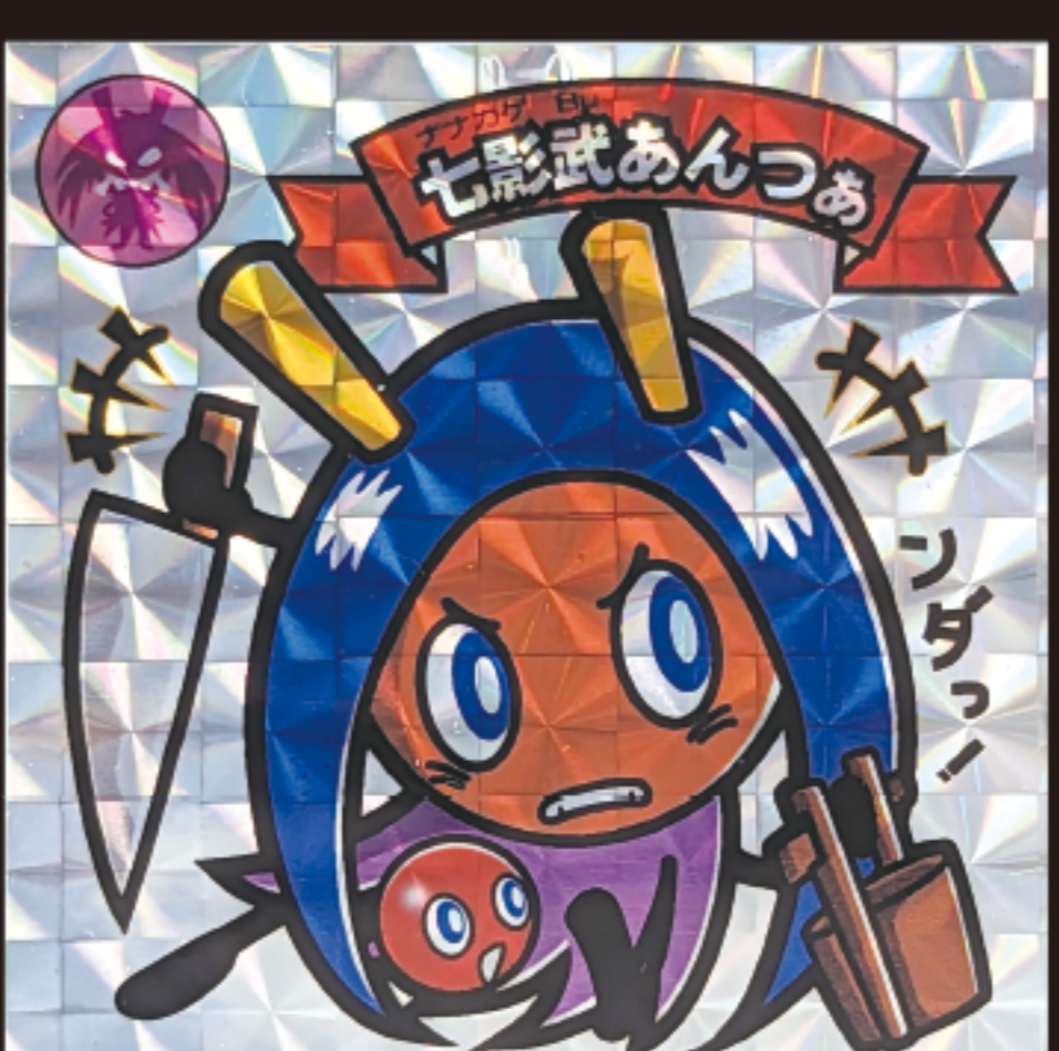
図2…エイプリルフルのネタとなったシール