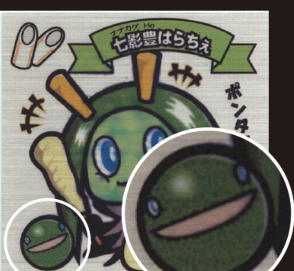
図4…第一弾は7つの『だまこ神』を巡る戦いを描いたストーリーだった