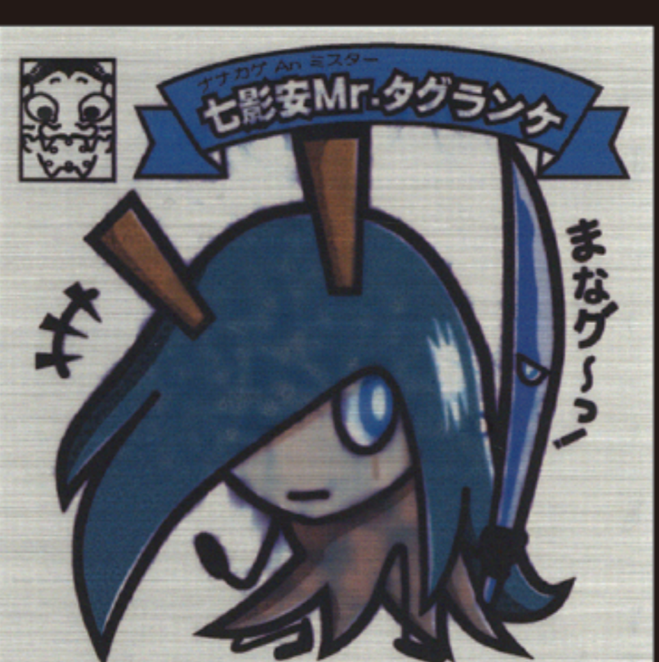
図3…時間経過によりインクがにじんでしまったシール