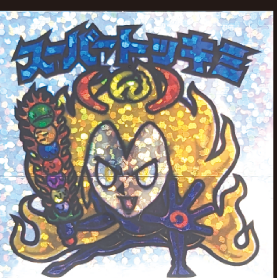
図5…だまこ神を7つ集めて『突鬼火β』がヘッドに昇格した