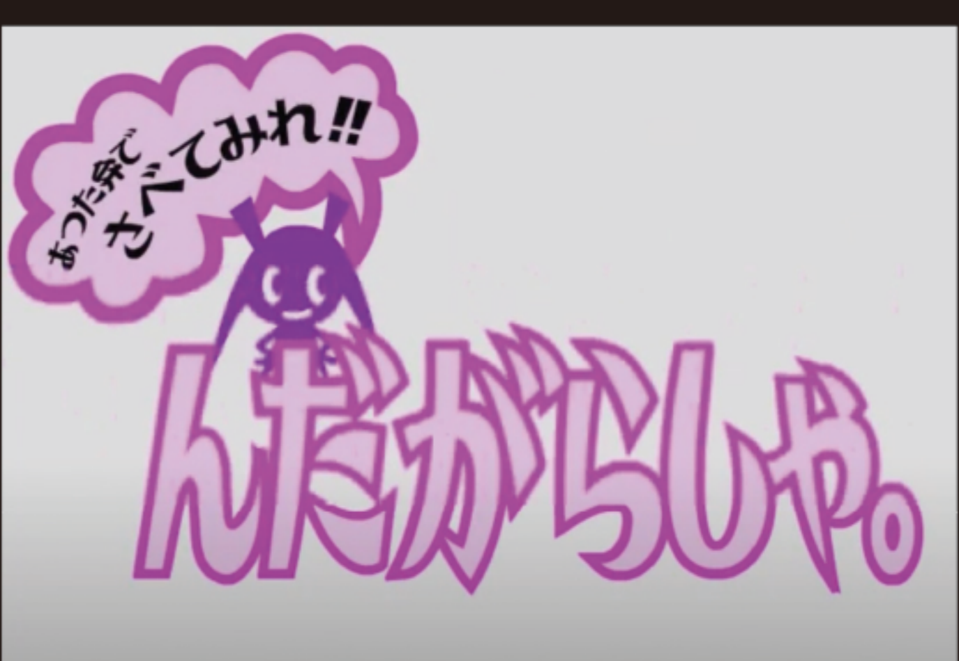
図1…フラッシュアニメ『んだからしゃ』。

ボランティアみたいな(笑)本業はウェブデザインやグラフィックデザインをしてまして、自分の時間でドデンマンを含む、秋田弁普及活動をやってました。